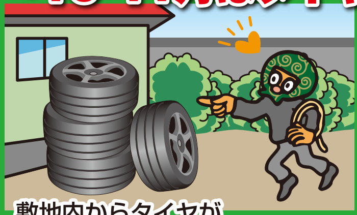
敷地内からタイヤが盗まれるケース