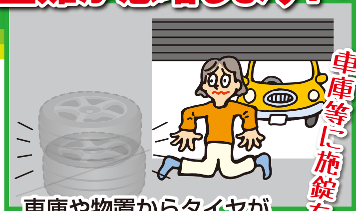
車庫や物置からタイヤが盗まれるケース