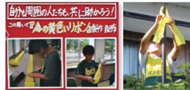
「命の黄色いリボン」の製作、配布