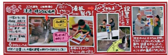
「迷わず、避難」看板の製作、設置