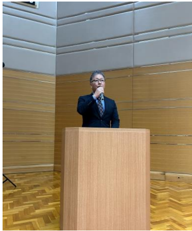
高口委員長の主催者挨拶