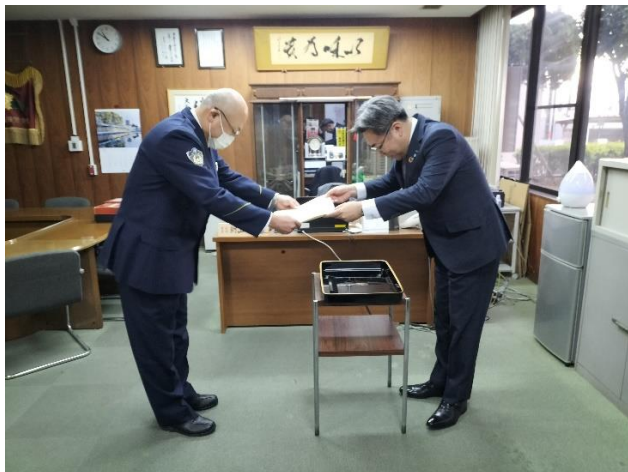
藤居会長（右）から朝山署長（左）へ贈呈

当支部は、今後も警察等と連携しながら、不正請求の排除に向けた活動に取り組むことで、損害保険事業の健全な運営を行ってまいります。