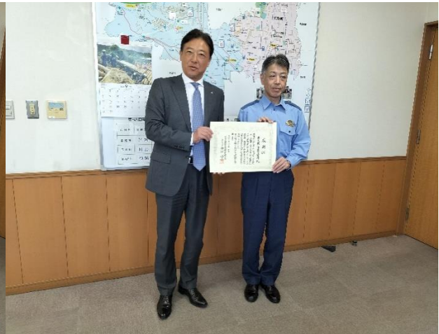
横澤会長（左）、山口署長（右）