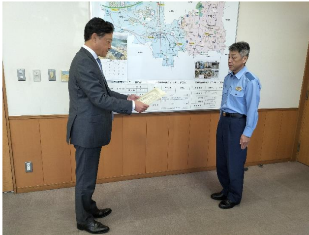
横澤会長（左）から山口署長（右）へ贈呈

当支部は、今後も警察等と連携しながら、不正請求の排除に向けた活動に取り組むことで、損害保険事業の健全な運営を行ってまいります。