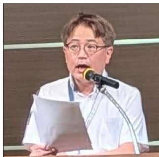
活動報告：大高幹事 (損保ジャパン社)