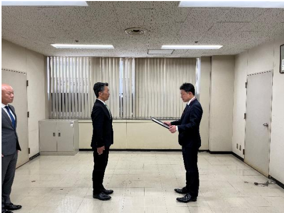
感謝状贈呈の様子

九州・沖縄支部委員会では、今後とも情報交換などを通じて、不正請求の防止に努めるほか、日頃から警察等の関係機関と連携を図ることで、健全な損害保険の発展および円滑・迅速な保険金支払いのために取り組んでまいります。