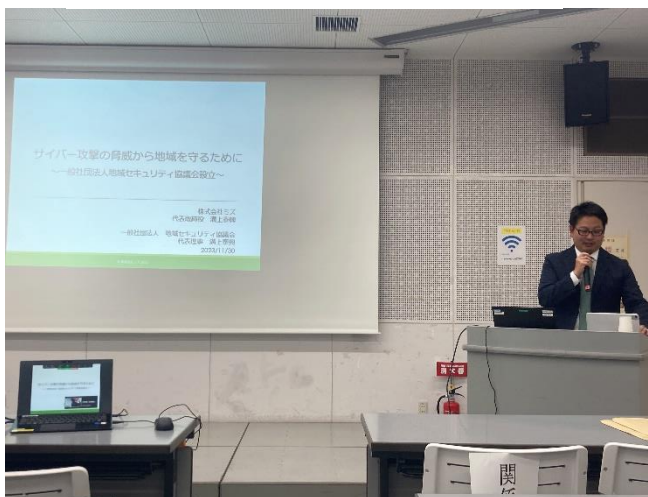
溝上ミズ代表取締役による講演