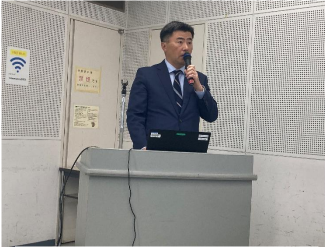
主催者を団表しての佐賀県保会による開会挨拶