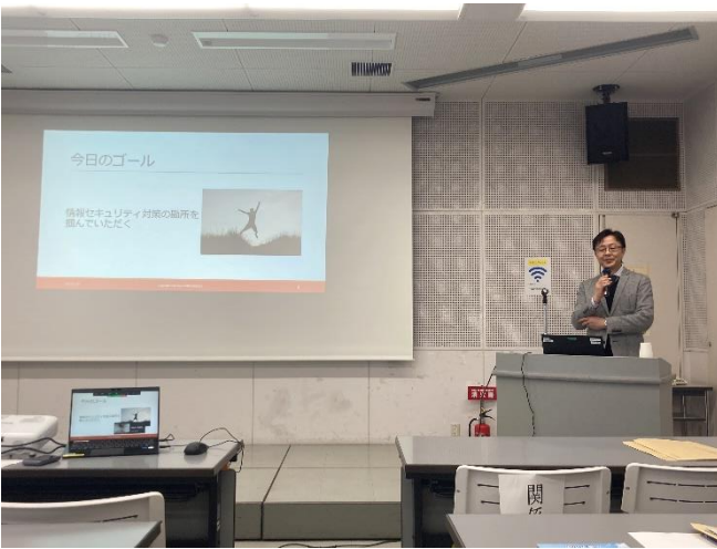
酒井中小企業アドバイザーによる講演