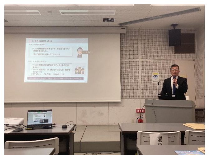
西出上席コンサルタントによる講演