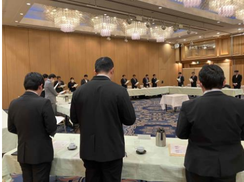
決議文唱和の様子