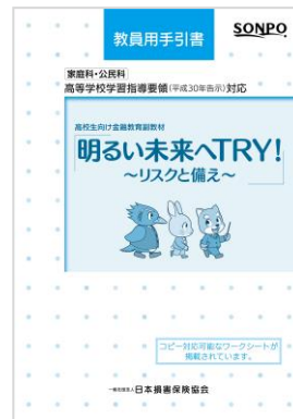
教員用手引書 のイメージ