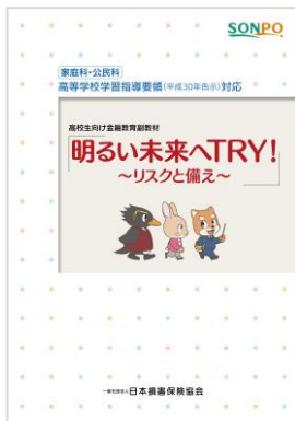
生徒用教材 のイメージ

なお、従前の教材に掲載していた「やってみたいこと」に潜むリスクを考える内容や資料も盛り込んでいるので、生活におけるリスクについて発展的な学習ができます。