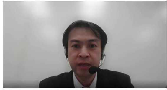
金融庁 下井保険課長による祝辞