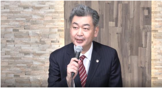
錦野先生による特別記念セミナー