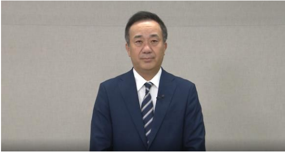
城田協会長による主催者挨拶