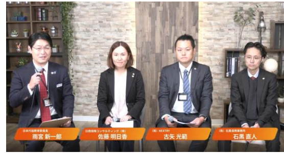
ゲストメッセージ