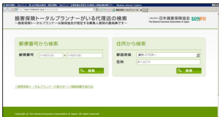
「損害保険トータルプランナーがいる代理店の検索」サイト