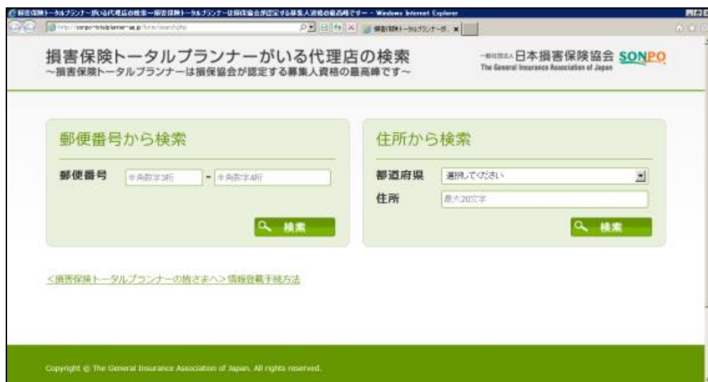
「損害保険トータルプランナーがいる代理店の検索」サイトイメージ図 ( http://sonpo-totalplanner-ag.jp/ )

消費者の方々からの「どこの代理店で保険を加入したらよいかわからない」という声にお応えするため、損保協会ホームページに、ご自宅や勤務先などの近くにある「損害保険トータルプランナー」がいる代理店を検索できるサイトを開設しています。